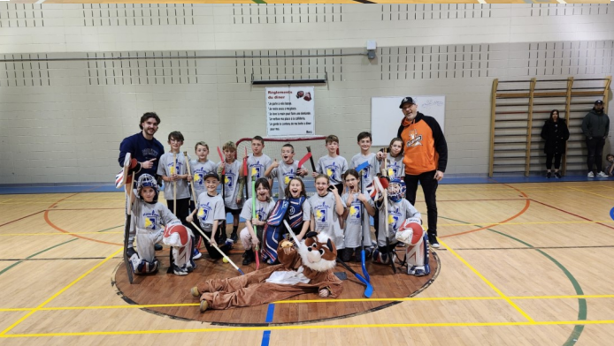
Multi-sports hockey balle 3e-4e année