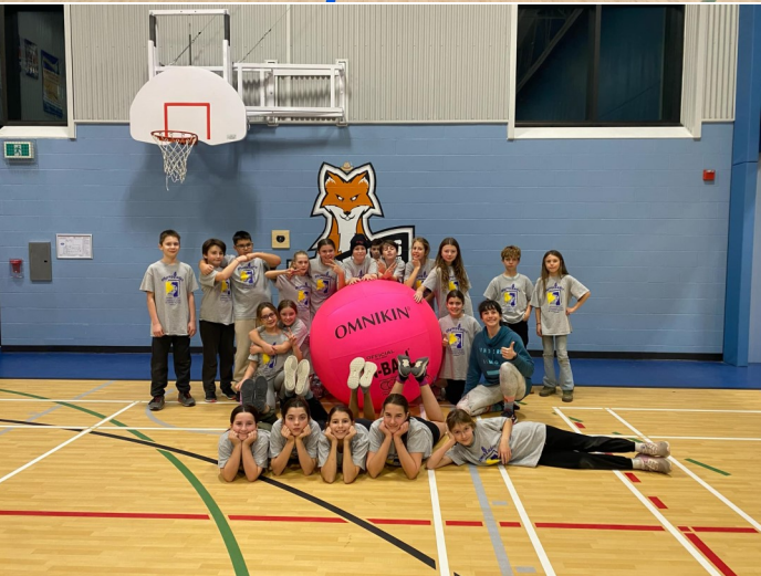
Multi-sports de Kin Ball 5e-6e année