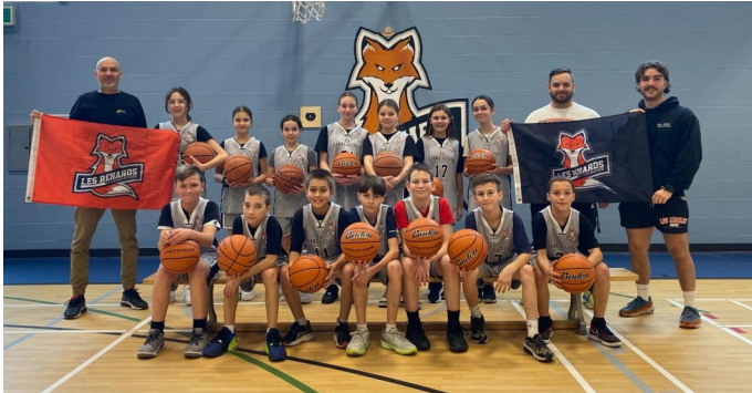
Équipe de Mini-Basket 2024-2025 6e année