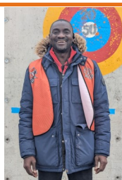
Duvernay Paris Éducateur spécialisé Maternelle, 1re 2e année Service de garde en fin de journée