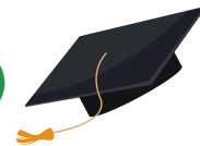
PHOTO DES FINISSANTS (6E ANNÉE)

Le mardi 5 mai prochain aura lieu la photo des finissants pour les élèves de 6e année. Il est important de porter un chandail uni gris, noir ou blanc seulement .