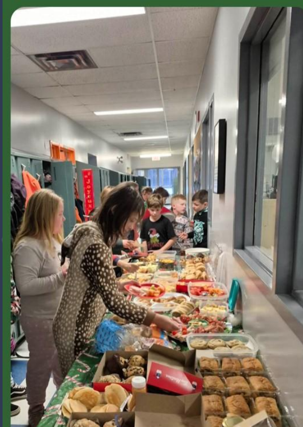
Déjeuner collectif des 4e année