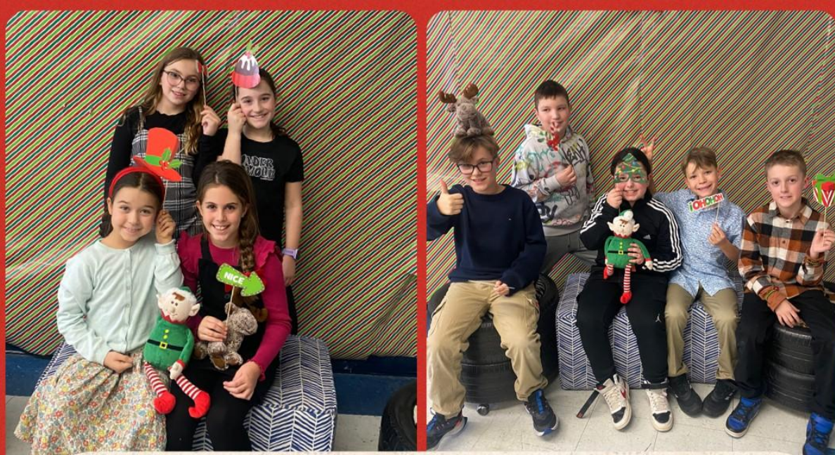
Séance photos festive groupe 401