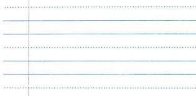
Annexe 1 : Cahier interligné avec pointillés