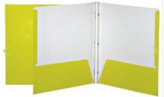
Annexe 4 : Duo-tang en carton avec pochettes intérieures (avec attaches)