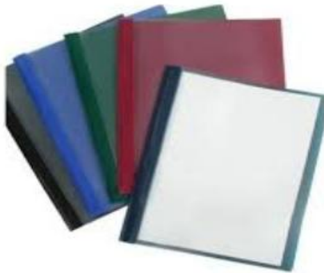
Annexe 3 : Duo-tang rigide avec pochette frontale transparente