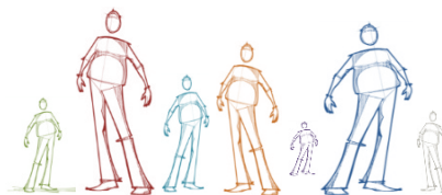
Carole Lord Directrice

L'évaluation du plan de lutte 2021-2022 sera approuvée par le Conseil d'Établissement.